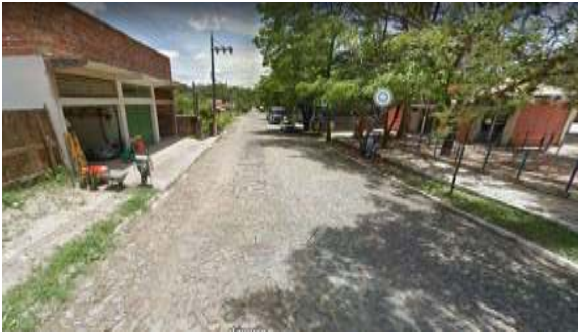
Figura 3: Rua Coronel Cristiano.

Serviço Público Municipal Processo nº 30391/2022 Data 20/12/2022_ Fls.____ Rubrica _____