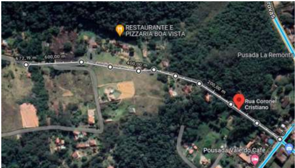
Figura 1: Rua Coronel Cristiano.