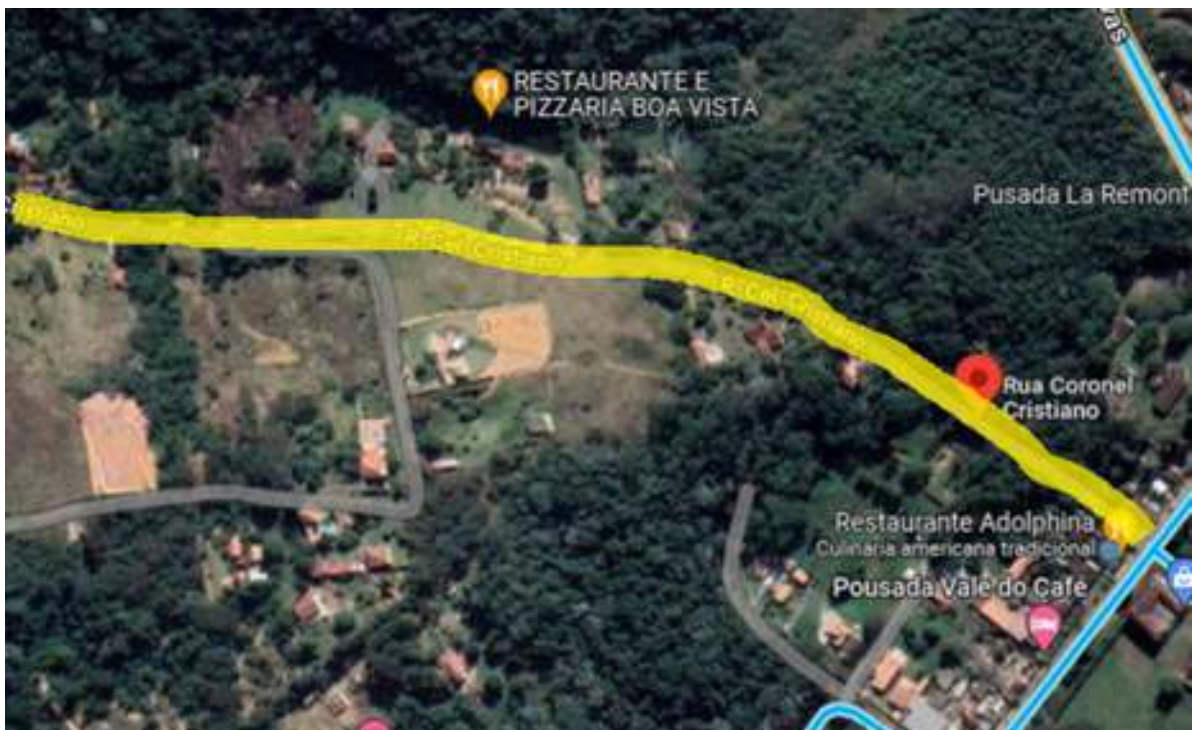
Figura 2: Rua Coronel Cristiano.