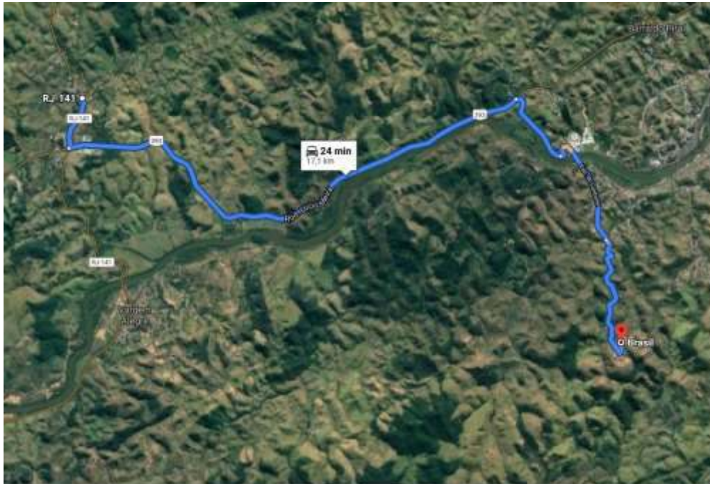
Figura 6: Localização Bota Fora